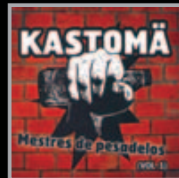
KASTOMÄ Mestres de pesadelos ROCK CALIFICACIÓN ★★★★★

“Hai un déficit notable de salas e lugares para tocar en directo”