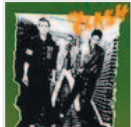
THE CLASH The Clash PUNK CALIFICACIÓN ★★★★★

► Primer disco (1969) de la banda liderada por Jimmy Page y Robert Plant. En él asentaron las que serían las bases del heavy sesentero. Contiene momentos clásicos como la admirable Babe I'm gonna leave you , Black mountain side y Good times bad times .