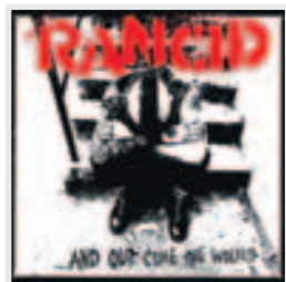
RANCID ...And Out Come the Wolves PUNK CALIFICACIÓN ★★★★★

► Disco con que esta banda surgida del punk británico se dio a conocer en el año 1977. El álbum, probablemente el mejor que publicaron, se lo produce Mickey Foote y supuso un considerable triunfo para el grupo liderado por Joe Strummer y Mick Jones.