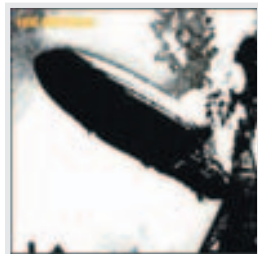
LED ZEPPELIN Led Zeppelin I ROCK CALIFICACIÓN ★★★★★

► Primer disco (1969) de la banda liderada por Jimmy Page y Robert Plant. En él asentaron las que serían las bases del heavy sesentero. Contiene momentos clásicos como la admirable Babe I'm gonna leave you , Black mountain side y Good times bad times .